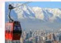
นั่งกระเช้าขึ้นสู่เนินเขาซานต้า ลูเซีย