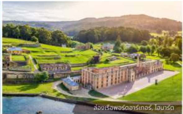
ล่องเรือพอร์ตอาร์เทอร์, ไอบาร์ต