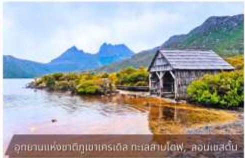
อุทยานแห่งชาติภูเขาคเรเดียล ทะเลสาบโตฟ, ลอนเนสตัน