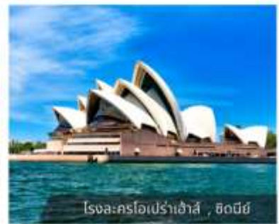
โรงละครโอเปร่าเฮ้าส์, ซิดนีย์