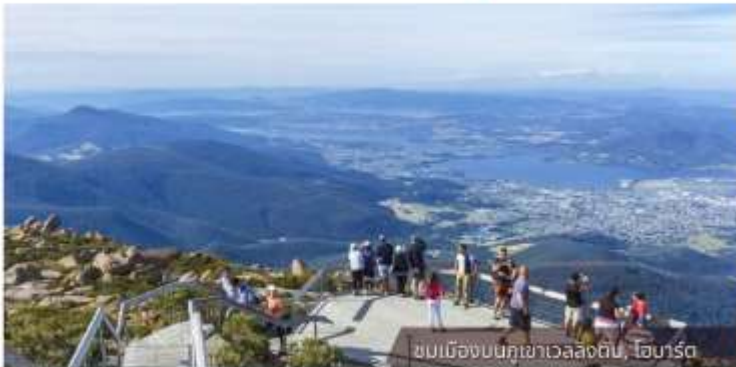
ชมเมืองบนภูเขาเวลลิงตัน, ไอบาร์ต