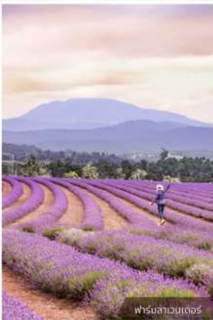
ฟาร์มลาเวนเดอร์