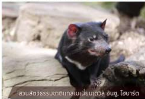
สวนสัตว์ธรรมชาติแทสเมเนียเดวิล อินซู, ไอบาร์ต