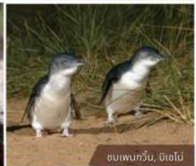
ชมเพนกวิน, ดิเซโป