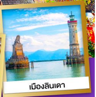
เมืองลินดา