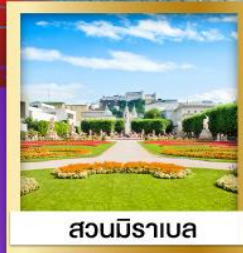
สวนมิราเบล