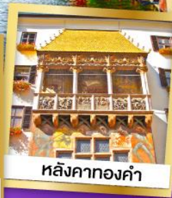
หลังคาทองคำ